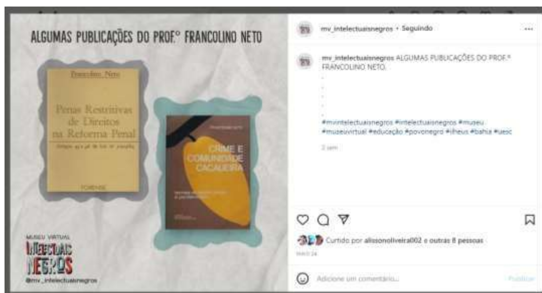
Figura 5 – Imagem do Museu no Instagram apresentando alguns livros de autoria do prof. Francolino Neto

Na Figura 4 é possível ter um panorama da página Museu Virtual: intelectuais negros/negras para a sala de aula, com a descrição da página, links de acesso, logotipo, fotografia do prof. Francolino Neto jovem, entre outras informações.