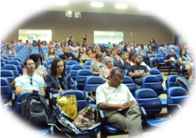
Público presente no evento.