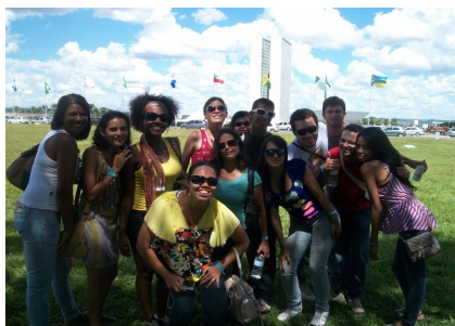
Alunos de Letras da UESC e da UESB presentes no I Encontro Latino-americano dos estudantes de Letras em 2011, na UnB– Brasília.

O IV SEPEXLE ocorrerá de 21 a 23 de Maio de 2012, na Universidade Estadual de Santa Cruz, Ilhéus, Bahia. Os interessados em apresentar trabalho e participar devem se inscrever pelo site do evento http://www.uesc.br/eventos/sepexle/ivsepexle/ .