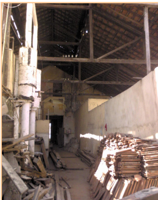
Figura 4 – Interior da fábrica, 2008.

Pensamos que transformar a antiga Usina Victória num espaço cultural, antes que se tornasse um “risco” de desabamento e forçar a sua demolição para dar lugar a estacionamento, mercado, ou no caso, entulho, poderia ser uma tarefa mais fácil e lucrativa para a cidade que, preservaria sua memória e ofereceria um museu do chocolate, ou coisa parecida, já que no interior dessa fábrica ainda existia as mais antigas máquinas de beneficiamento de cacau do Brasil, provavelmente do mundo (Figura 4 e 5), e até um automóvel da família Kauffman (Figura 6), uma das mais antigas e tradicionais na produção, industrialização e venda de cacau e derivados.