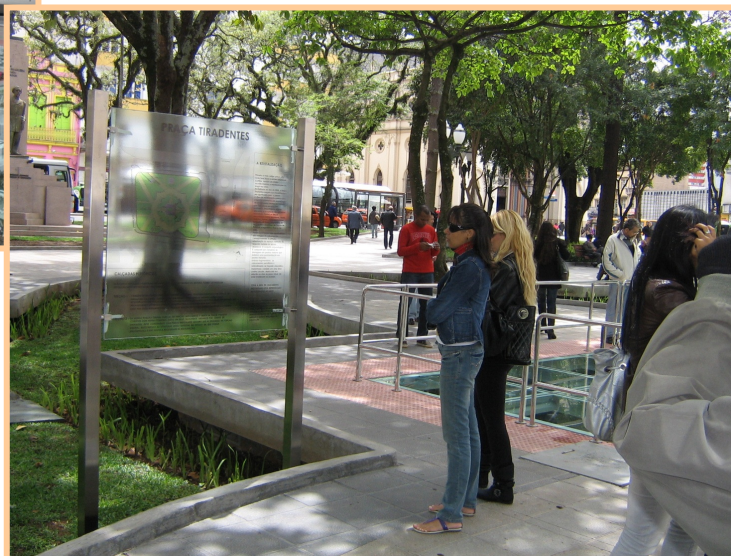
Figuras 7 e 8 – Detalhe da Praça Tiradentes (Curitiba-PR), sinalização turística e conservação de vestígios da época de fundação da cidade valorizam a experiência nesse segmento, 2008.