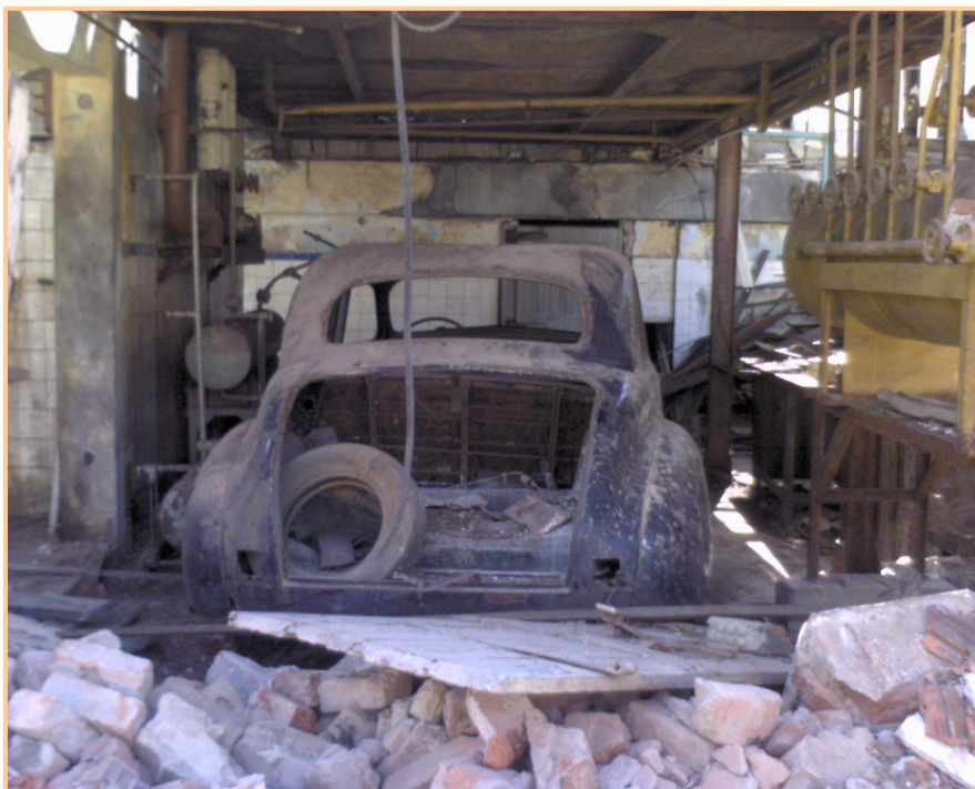
Figura 6 – Automóvel encontrado no interior da fábrica durante a demolição, 2008.

Estando atento para o aproveitamento racional deste espaço, desapropriar, recuperar, reerguer, transformar em espaço cultural de valor histórico seria o caminho a ser adotado se a educação patrimonial tivesse uma sistematização e não se constituísse apenas na realização de atividades esporádicas que envolvam o turista, deixando de lado a comunidade local.