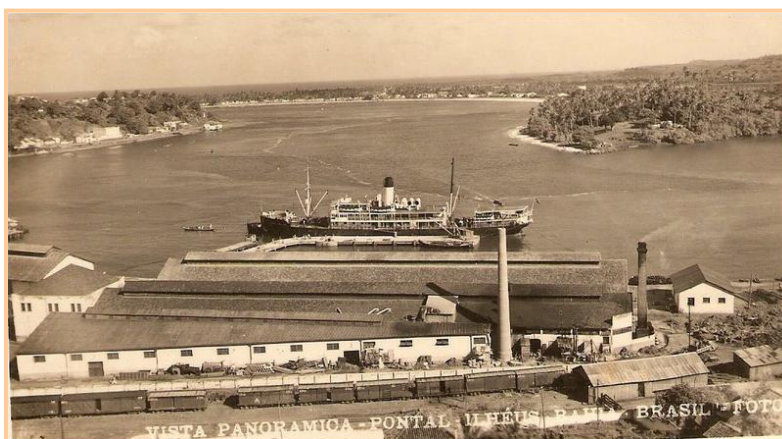
Figura 3 – Antigo “Porto de Ilhéus” e Fábrica de Chocolate “Cacau Industrial e Comercial”. Década de 1930, aproximadamente.

Outrossim, percebemos a transformação espacial que tende a tornar obsoleto tudo que se refere ao passado, opondo modernidade e memória. Assim como as praças, os armazéns do Antigo Porto de Ilhéus poderiam auxiliar nesse processo de valorização cultural e, ainda, servir como uma constante fonte de recursos para a cidade, uma vez que turistas, pesquisadores e escolas poderiam explorar uma série de objetos, que fizeram parte da história da cidade (Figura 3).