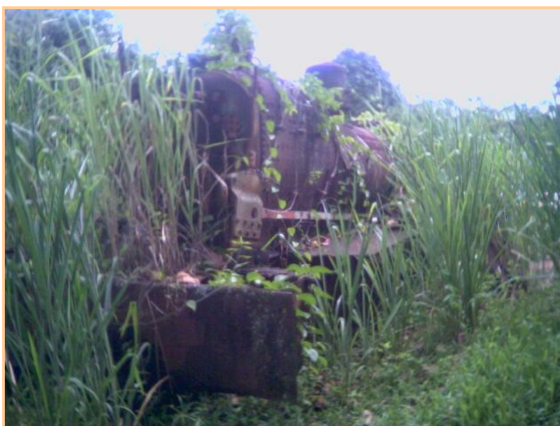
Figura 2 – Ruínas da velha locomotiva, 2006.

Figura 1 - “Maria-Fumaça” sendo removida do local onde permaneceu até 1982, sem nunca ter recebido uma reforma. Década de 1980.