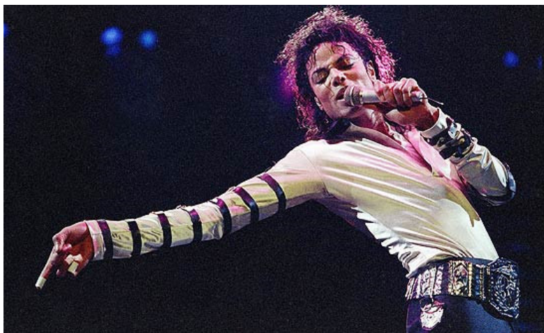
Michael Jackson em foto de 1988; gravadora Sony anunciou que lançará música inédita do astro em outubro

A partir do referencial teórico apresentado, nesta parte do trabalho está presente a análise de fotografias e legendas (ou textos-legenda) de publicações nacionais on line . Escolheu-se analisar primeiro os elementos ligados à forma e conteúdo das imagens, para posteriormente fazer análise da forma e do conteúdo das legendas.