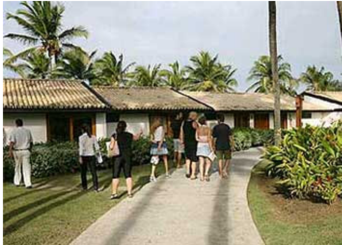
O programa vai oferecer cursos de capacitação e qualificação

segunda parte da legenda possui um sintagma nominal, “governo”, e um sintagma verbal e seu complemento, “oferece recompensa por incendiários”, trazendo informações acessórias sobre elementos não mostrados na fotografia e que se referem a supostos culpados pelo ocorrido, subtendendo-se que a notícia em questão possui uma suíte (resumo que atualiza o leitor em seqüências de notícias) que explique a constatação de que a notícia não se refere a um acidente.