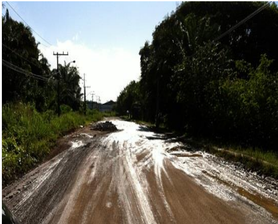
Figura 3 – Estado de uma das pistas principais de acesso às empresas do PII.