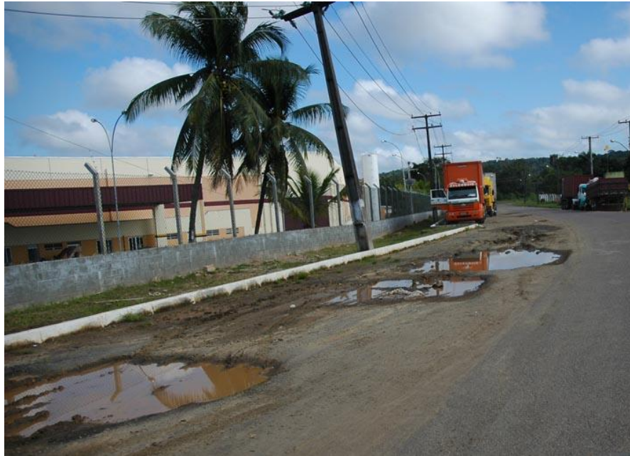
Figura 2 – Estado das pistas no Distrito Industrial.