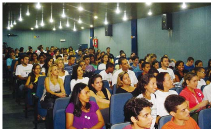
Alunos e profissionais de Biomedicina lotaram o auditório Jorge Amado, na UESC