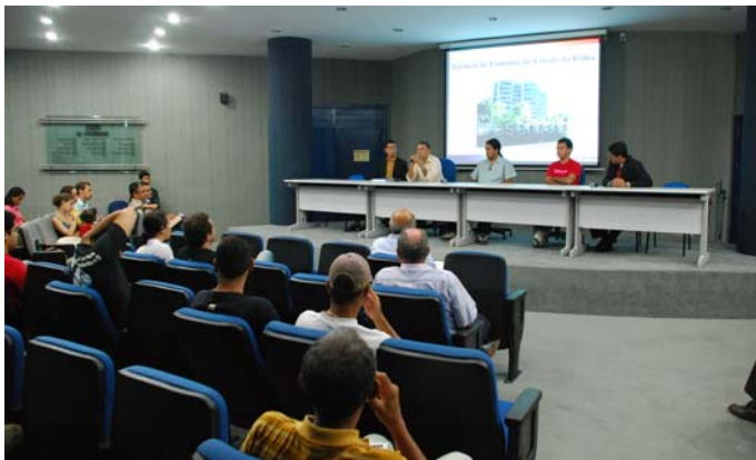
A abertura do seminário.

Debate oportuno frente aos investimentos previstos para o Sul da Bahia