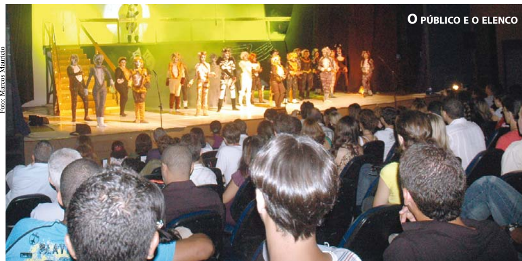
O PÚBLICO E O ELENCO

em “A Lenda de Um Romance Proibido”, o amor alegre e feliz em “A Noviça Rebelde”. E, ainda, a música da escuridão de “O Fantasma da Ópera”, “Jesus Cristo Superstar”, “Whistle Down the Wind”, “Chicago”, “Procição ou Jesus no Xadrez”, do “Cordel do Fogo Encantado” e, fechando, o musical, a luta por um mundo de equilíbrio entre os homens, em “Os Miseráveis”, obra prima de Victor Hugo.