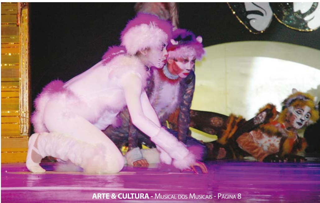
ARTE & CULTURA - MUSICAL DOS MUSICAIS - PÁGINA 8