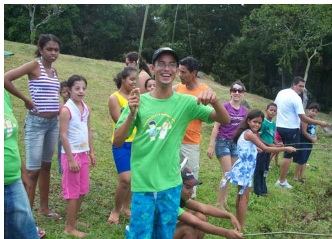
Flashes fotográficos feitos na Fazenda Catulé

O Núcleo Aprendendo Down encerrou as suas atividades, em 2009, com um dia de lazer na Fazenda Catulé, que contou com a participação de portadores da síndrome, pais, integrantes do Núcleo e amigos da causa Down. “Foram vivenciados momentos inesquecíveis, pescando, fazendo trilha, curtindo a natureza e, sobretudo, desfrutando o direito a pertencer, abençoados por Deus, na certeza de que