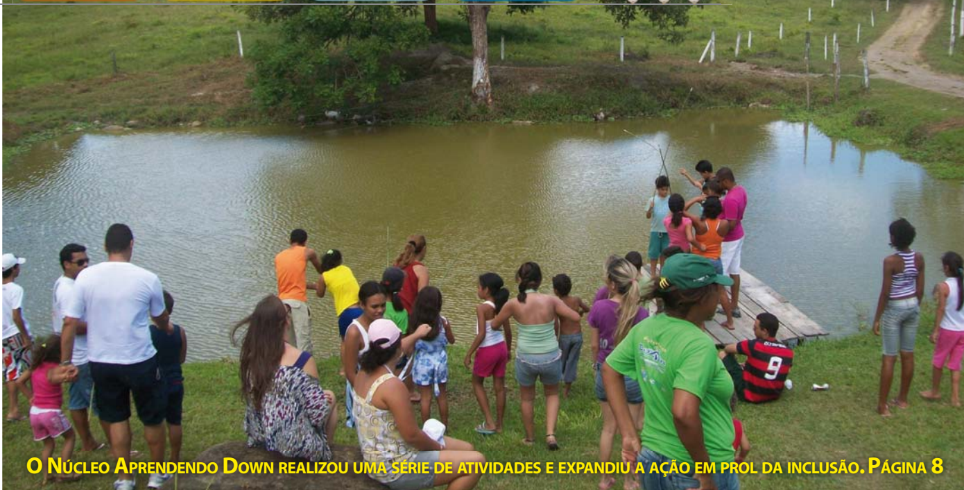
O NÚCLEO APRENDENDO DOWN REALIZOU UMA SÉRIE DE ATIVIDADES E EXPANDIU A AÇÃO EM PROL DA INCLUSÃO. PÁGINA 8