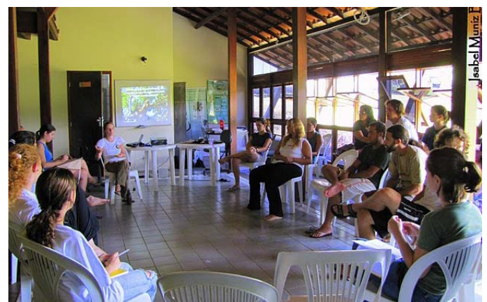
Reserva possui sede bem estruturada.