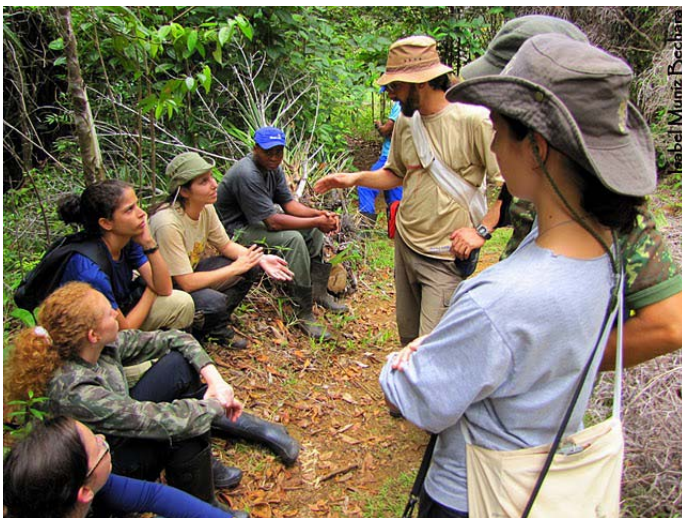
Aula de campo.

A IMPORTÂNCIA DO ESTUDO DOS PRIMATAS É FUNDAMENTAL PARA A SOLUÇÃO DE DIVERSOS PROBLEMAS RELACIONADOS À SAÚDE DO HOMEM.