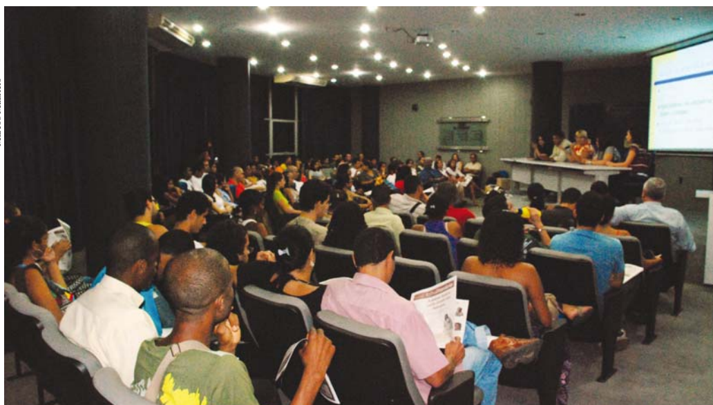
Parte da plateia e a mesa ao fundo

A Fundação Pedro Calmon, unidade da Secretaria de Cultura do Estado da Bahia (Secult), lançou, na UESC, a Revista História da Bahia. O destaque prin-