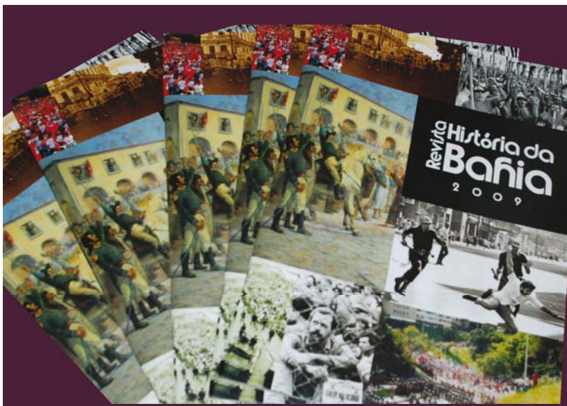
A Revista História da Bahia teve lançamento na UESC