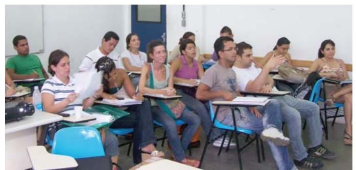
Aula teórica de análise dos resultados