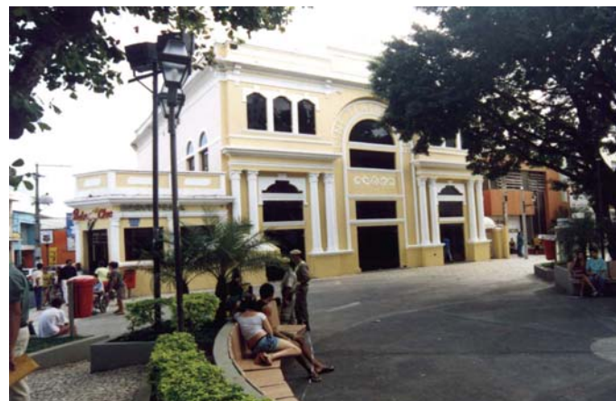
Exposição de arte regional permanente na sede da Maramata, em Ilhéus (E), e o Teatro Municipal de Ilhéus são importantes produtos culturais.