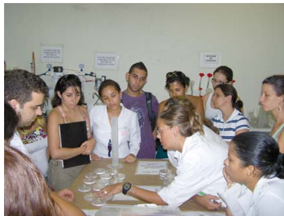
Análise dos resultados após aula prática na sala de lavagem do CBG

Um dos pontos importantes do curso foi a apresentação do “Teste de Salmonella/Microsomo”, que é usado para avaliar a seguridade de