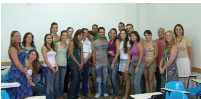
Participantes inscritos ao final do curso