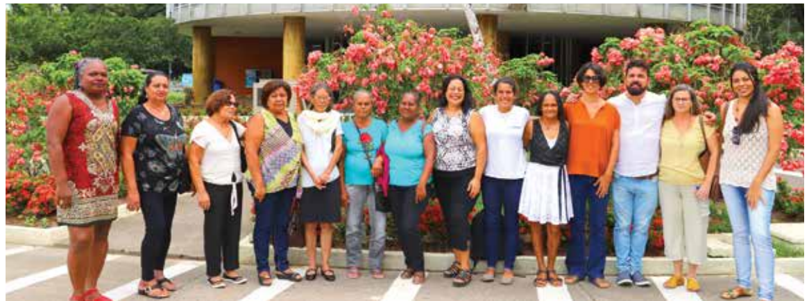
Lideranças femininas de Serra Grande com integrantes da banca examinadora.

A apresentação pública da dissertação de mestrado também foi uma oportunidade para que as mulheres que fizeram parte da pesquisa visitassem a Universidade pela primeira vez. “Este olhar sobre o nosso mundo feminino não tem preço. Desejo que outras pesquisas, sensíveis como esta,