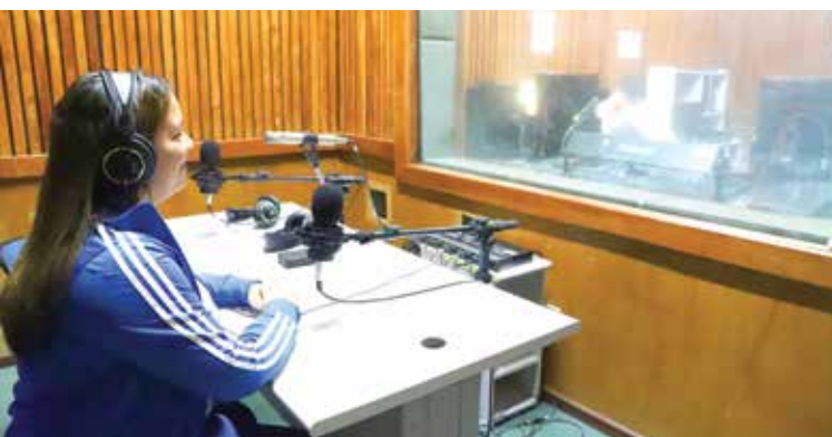
Laboratório de Som.