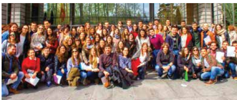
Imagem coletiva no encerramento.

O projeto teve o apoio da Pró-Reitoria de Extensão (Proex) para gerar uma ação técnica, transformadora e amplamente correta no Salobrinho, ensinando e estimulando a comunidade quanto a utilização mais sustentável dos recursos hídricos. A iniciativa integra o Programa UESC-Salobrinho cuja meta é a inserção da Universidade no bairro onde o seu campus está situado.