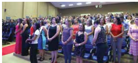
Alguns flagrantes das formaturas na UESC