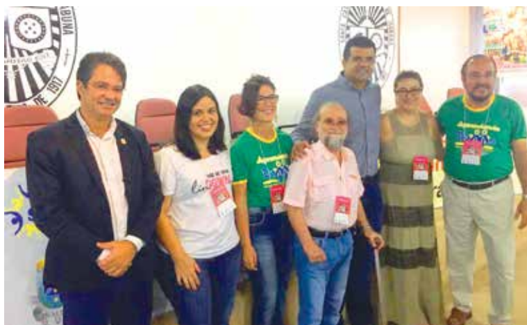
Palestrantes, organizadores do evento e representantes da UESC

Centrado na temática “Não deixe ninguém para trás”, o Núcleo Aprendendo Down da UESC realizou mais um seminário em que foram destacados os avanços recentes no atendimento às pessoas portadoras da Síndrome de Down. O evento, que aconteceu no mês março (16), no auditório da Santa Casa de Misericórdia de Itabuna, reuniu estudiosos da S. Down e demais segmentos comprometidos com a divulgação e o aprendizado de conhecimentos sobre a trissomia do cromossomo 21.