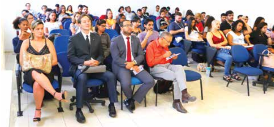
Mesa de abertura e público do II Cemigrar