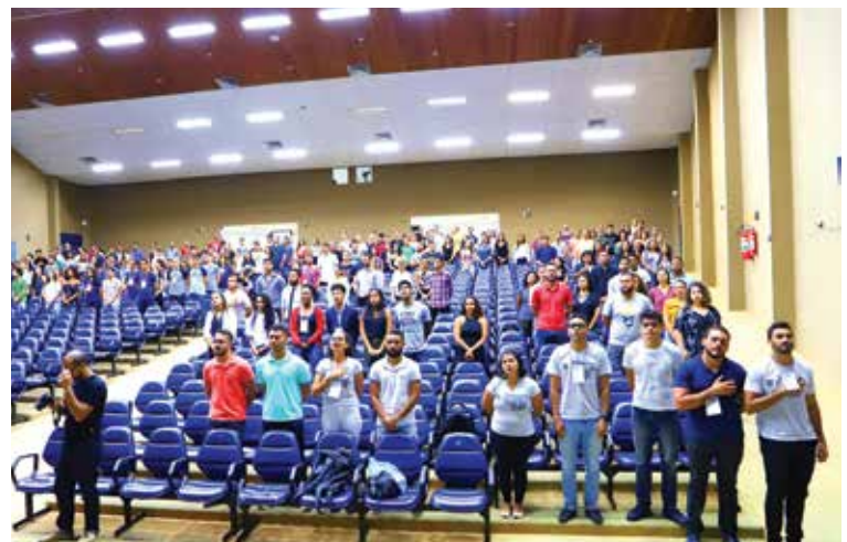
Estudantes, profissionais do Direito e professores presentes ao evento