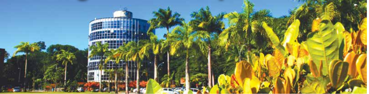
Campus Soane Nazaré de Andrade

A Universidade Estadual de Santa Cruz está entre as nove universidades estaduais do Brasil como aquelas que detêm mais artigos científicos publicados. Esta posição coloca a UESC também como a primeira no conjunto das estaduais da região Nordeste do país e a sexagésima no ranking das 100 universidades e institutos brasileiros com mais trabalhos científicos divulgados. A notícia coincidiu com os (22 de abril) 45 anos do seu campus universitário e reflete a importância da universidade, que ele abriga, para o desenvolvimento científico brasileiro.