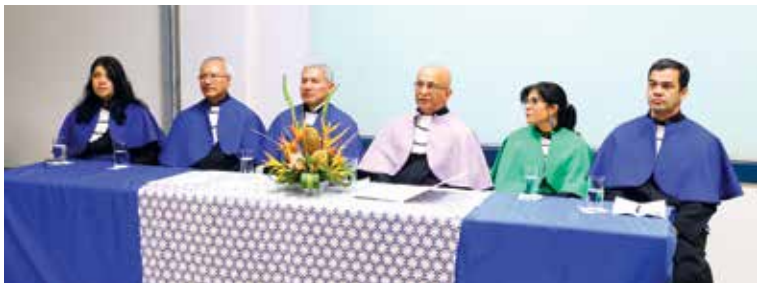
Cerimônia via web conferência para formandos em cidades mais distantes da UESC.

O Núcleo Universidade Aberta do Brasil (EaD) da UESC graduou em março (15, 22 e 29) 347 licenciandos em Pedagogia, Letras, Biologia e Física distribuídos pelos dez polos de abrangência da Universidade, em território baiano. O calendário foi aberto no dia 15 com a formatura de 110 concluintes de Pedagogia dos polos de Ibicuí, Ilhéus e Itabuna, em cerimônia no auditório da UESC. E, por meio de web conferência, na mesma data foram graduados 34 no polo de Amargosa e 27 no polo de Teixeira de Freitas, totalizando 171 pedagogos.