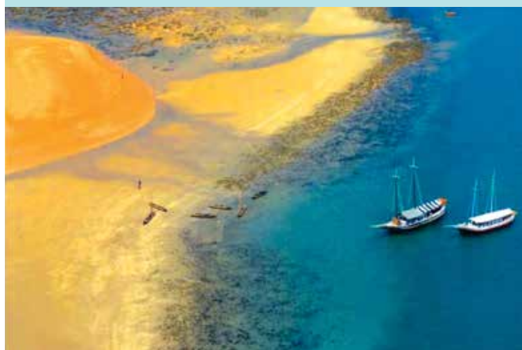
MPF pede proteção para o Parque Marinho de Coroa Alta, em Santa Cruz Cabrália.

Segundo o Ministério Público Federal (MPF) a visitação excessiva de pessoas ao Recife Marinho de Coroa Alta, em Santa Cruz Cabrália (BA), está pondo em risco o equilíbrio do ecossistema local. Neste sentido, embasado em relatório de pesquisas ambientais na área, o MPF está recomendando à administração pública municipal local, entre outras providências, a elaboração de um plano de manejo e zoneamento da área do Parque Municipal de Preservação Marinha de Coroa Alta. As medidas estão embasadas em pesquisas científicas desenvolvidas no âmbito da Universidade Estadual de Santa Cruz (UESC), tornadas públicas no ano passado.