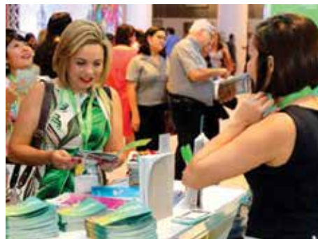
Alguns flagrantes do evento.

Nosso negócio – “Faz parte da nossa visão contribuir com ações que venham a ver com o meio ambiente, com a sustentabilidade e com a multiplicação de árvores, as ações da ABAF estão muito