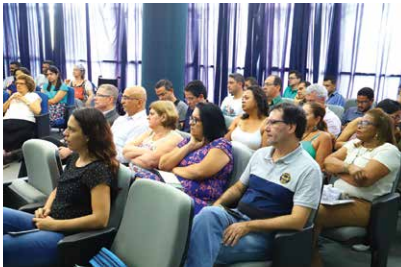
Público presente nas posses