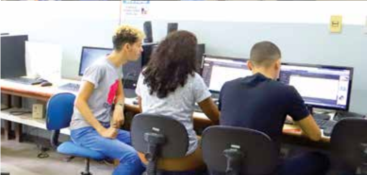
TV UESC e Sala de Redação Informatizada