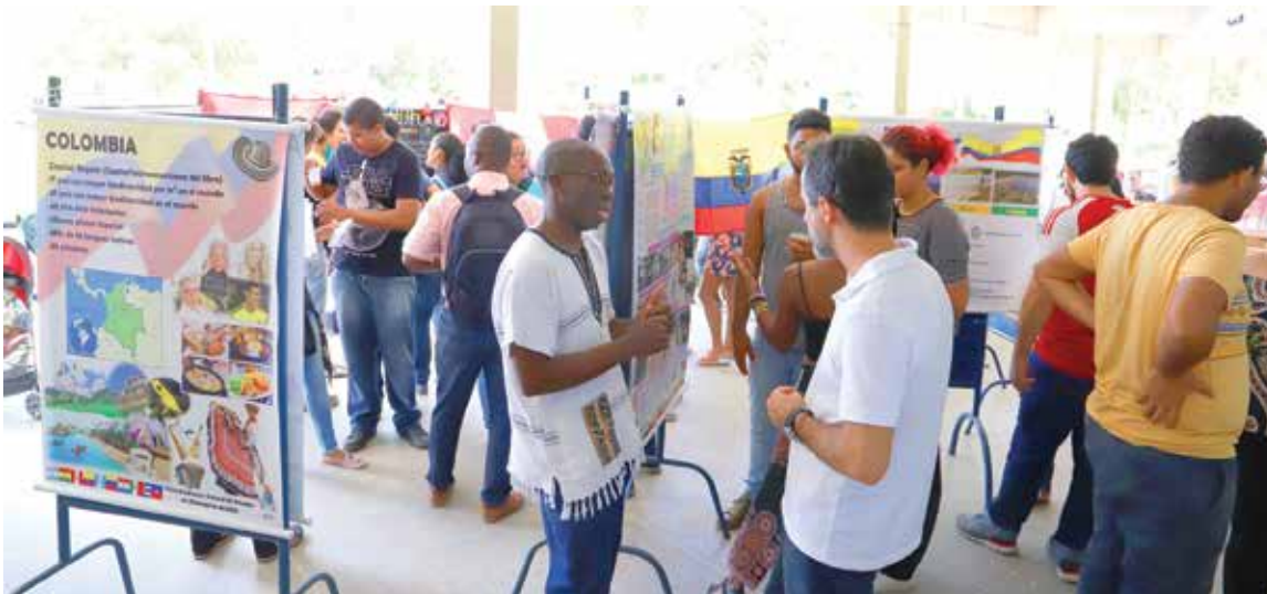
A Arint fez exposição de pôsteres dos países de origem dos visitantes.

A Feira Acadêmico-Cultural de Estudantes Estrangeiros, em março (23), foi uma das atividades de integração à UESC de cerca de 500 estudantes estrangeiros de mestrado e doutorado participantes do PAEC – Programa de Aliança para a Educação e Capacitação de Mestrados e Doutorandos das Américas e de outros programas. Eles vieram de países da América do Sul, Caribe e América do Norte, tais como Argentina, Bolívia, Chile, Colômbia, Equador, Guatemala, México, Paraguai, Peru e Venezuela, entre outros. Do Continente Africano vieram estudantes de Moçambique, que aderiram ao Programa Brasil-África.