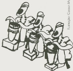
Ilustração: Cássia Moura