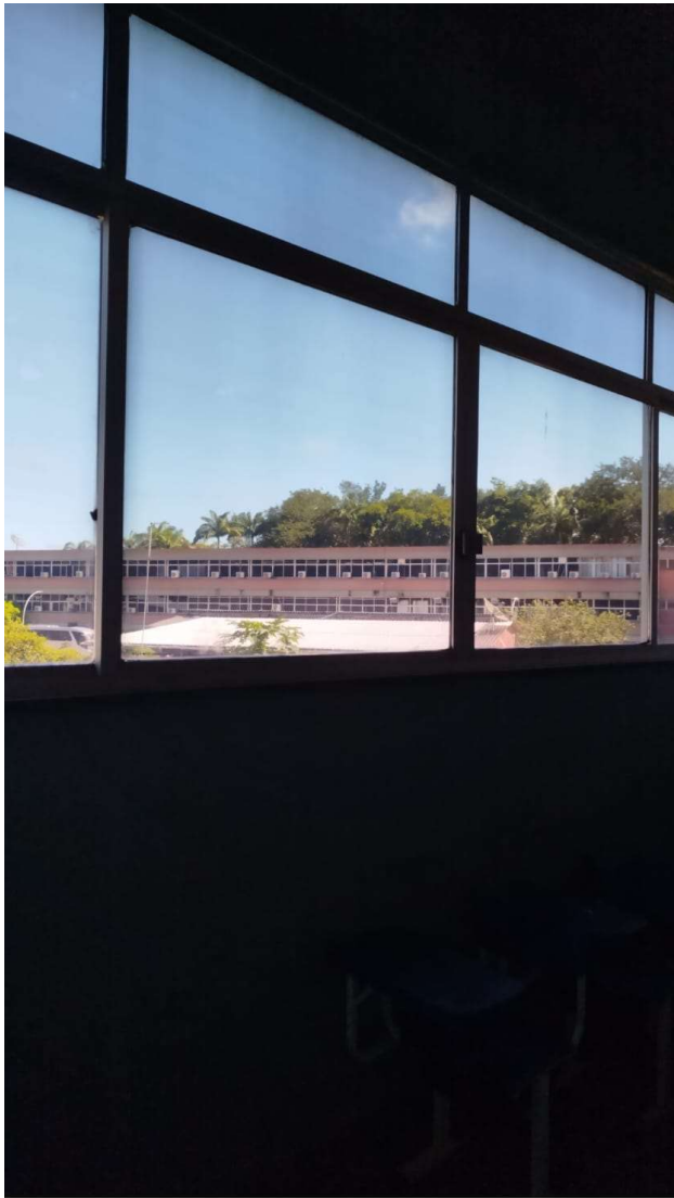
REDMI Note 13

24mm | f/1.7 | 1/60s | ISO64 09/03/2026 14°47'45"S 39°10'16"W