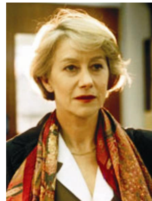
Figura 3 – Inspetora principal de Prime suspect

Trazendo as mulheres para o comando de uma delegacia de investigação, centrando o foco das ações como personagens principais, outras inovações começaram a aparecer, porém não poderei, no momento, me estender sobre elas. 10 É certo que houve uma mudança drástica na representação de mulheres com voz de comando nas séries da década de noventa e nas atuais. Desde o início de 1990, todas as séries investigativas ampliaram o raio da narrativa, agregando, ao ambiente público, o privado, ao trazer para dentro dos espaços das chefaturas de polícia os problemas da vida cotidiana de suas protagonistas, como nas três séries, Julie Lescaut (França, 1992), Prime suspect (Inglaterra, 1991) e Testemunha silenciosa (Inglaterra, 1996), e inovaram ao tratar da vida privada dessas mulheres 11 . Começaram a desvendar as complicadas relações do ambiente doméstico das mulheres e as difíceis relações de gênero e poder no casamento ou as implicações da dupla jornada, a partir de uma mãe divorciada com duas filhas, ainda na faixa etária infantil e adolescência 12 , ou a situação da mulher de sucesso, solteira e madura, harmonicamente equilibrada, tanto emocional quanto profissionalmente, mas que não encontra a mesma equivalência na vida afetiva. Todas as três protagonistas permanecem sozinhas, mesmo tendo alguns parceiros esporádicos ao longo das séries.