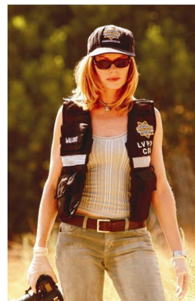
Figura 5 – Cath, da série CSI