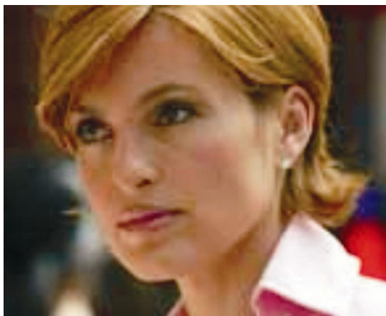
Figura 4 – Olívia, da série Law & Order: SVU

Mais claramente esta “mensagem” vai se delineando nas séries, citadas aqui cronologicamente: Lei & ordem: SVU (EUA, 1999), CSI (EUA, 2000), Without a trace (EUA, 2002), Cold case (EUA, 2003), NCIS (EUA, 2003), Numb3rs (EUA, 2005) e Criminal minds (2005).