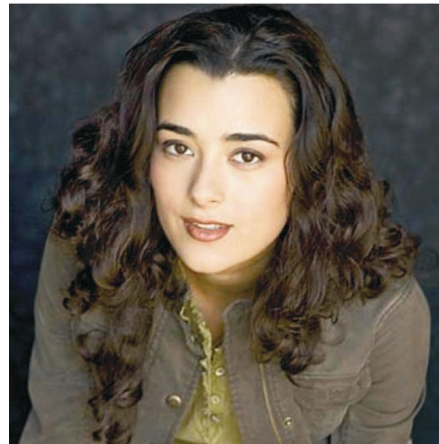
Figura 7 – Ziva, investigadora civil de NCIS

Algumas dessas séries derivaram de outras da década de noventa ( spins ) como Law & Order: SVU ou NCIS (derivada de Jag ) ou Criminal Minds (de Profiler ), e mesmo a mais inovadora delas, que é CSI , que inova trazendo para o foco central da narrativa os investigadores forenses que atuam determinando as evidências, colaborando, paralelamente, com detetives e policiais, permanece mantendo o mesmo paradigma dominante dos anos noventa, inclusive esmaecendo, cada vez mais, os conflitos das relações de gênero existentes em um espaço de trabalho tenso e hierárquico, além de quase não lidar com o cotidiano dessas mulheres.